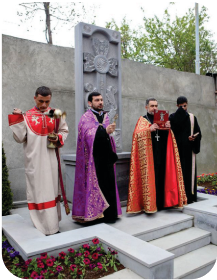
Եղեռնի 100-ամյա տարելիցին նվիրված խաչքարի բացում

«Երևանյան ամառ» ծրագրի շրջանակում կազմակերպվել են մանկական ժամանցային, ուսուցողական ծրագրեր, էքսկուրսիաներ, մրցույթներ: