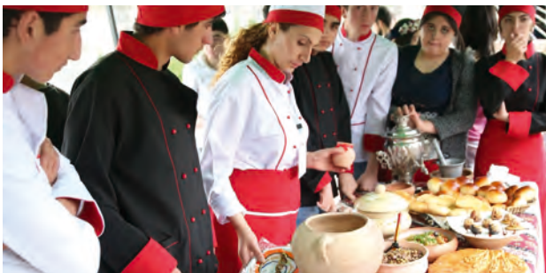
«Համով-հոտով Երևան» փառատոն