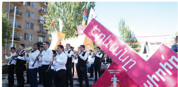
«Էրեբունի-Երևան 2799» տոնակատարություն

Yerevan.am կայքում գործում է « Միջոցառումների օրացույց » խորագիրը, որտեղ ներկայացվում է Երևանում անցկացվող մարզական, մշակութային և զբոսաշրջային նշանակության միջոցառումների մասին տեղեկատվություն: