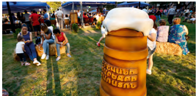
«Երևանի գարեջրի փառատոն»