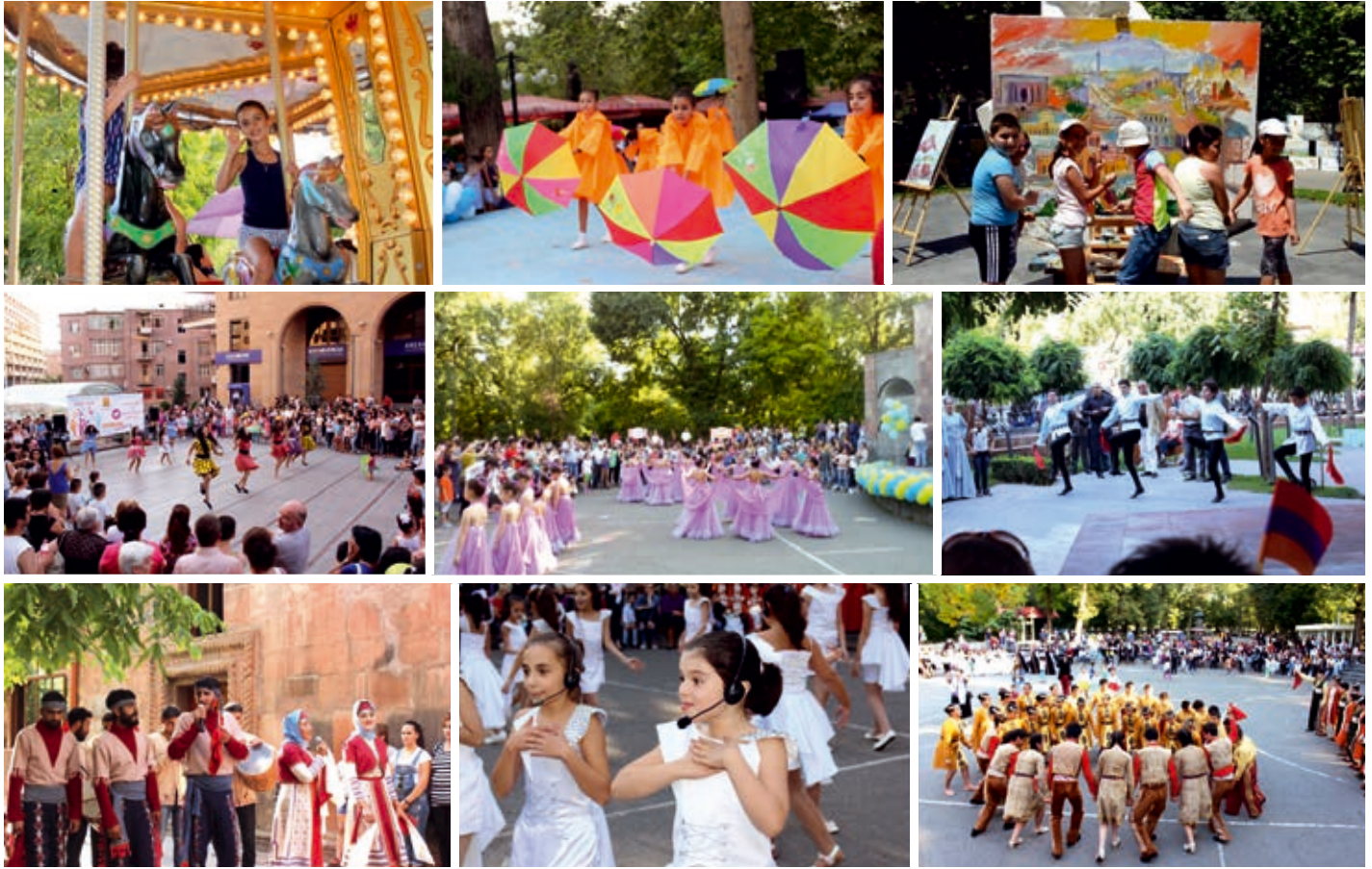
«Երևանյան ամառ» ծրագրի շրջանակներում կազմակերպվել է 22 բակային ճամբար: