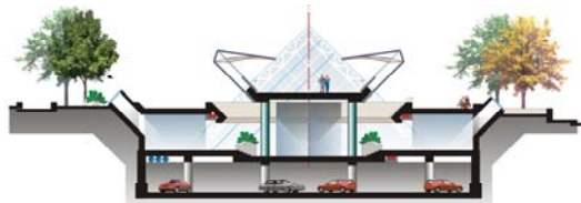
ԿՏՐՎԱԾՔ "4-4" Մ 1:400