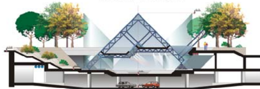
ԿՏՐՎԱԾՔ "5-5" Մ 1:400