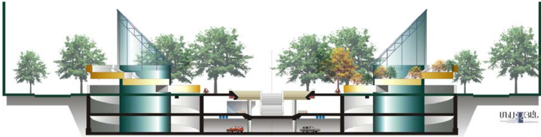
ԿՏՐՎԱԾՔ "2-2" Մ 1:400