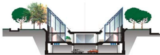
ԿՏՐՎԱԾՔ "6-6" Մ 1:400