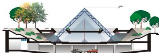
ԿՏՐՎԱԾՔ "3-3" Մ 1:400