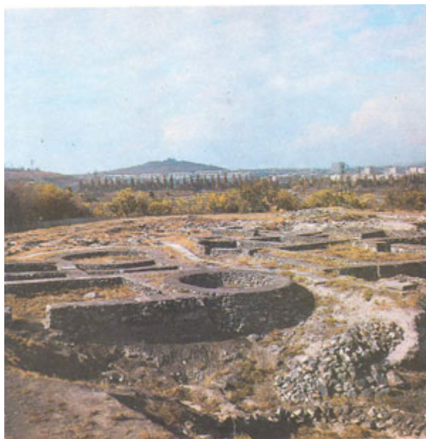
Шенгавитское поселение, V-III тыс. до н. э.

известных до сих пор письменных упоминаний. Известно, что территория Еревана была заселена задолго до основания крепости Эребуни. Как называлось обнаруженное на территории Еревана древнейшее поселение, сегодняшний Шенгавит, которому приблизительно 6000 лет, не известно. В этом смысле название Эребуни- древнейшее известное нам название армянской столицы.