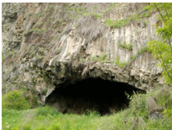
Ереванская пещера, 100 000-40 000 до н. э.