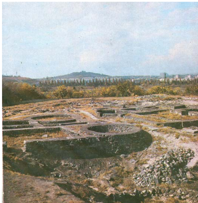
Շենգավիթ բնակատեղի , մ.թ.ա. 5-3-րդ հազարամյակներ

Երևան անունը և քաղաքի հիմնադրումը Նոյի հետ են կապում նաև Ռուբյան Աուզլեյը, Ռոբերտ Քեր Փորթը, 6 Ա. Հաքստհաուզենը, Լինչը 7 և ուրիշներ: Հայ պատմագրության մեջ վերոհիշյալ ավանդությանը անդրադարձել են Ղ. Ինժիճյանը, 8 Մ. Սմբատյանը և ուրիշներ: Այս տեսակետը այսօր էլ մնում է որպես ժողովրդական ավանդություն և վկայում է, որ Երևանը շատ հին բնակավայր է: